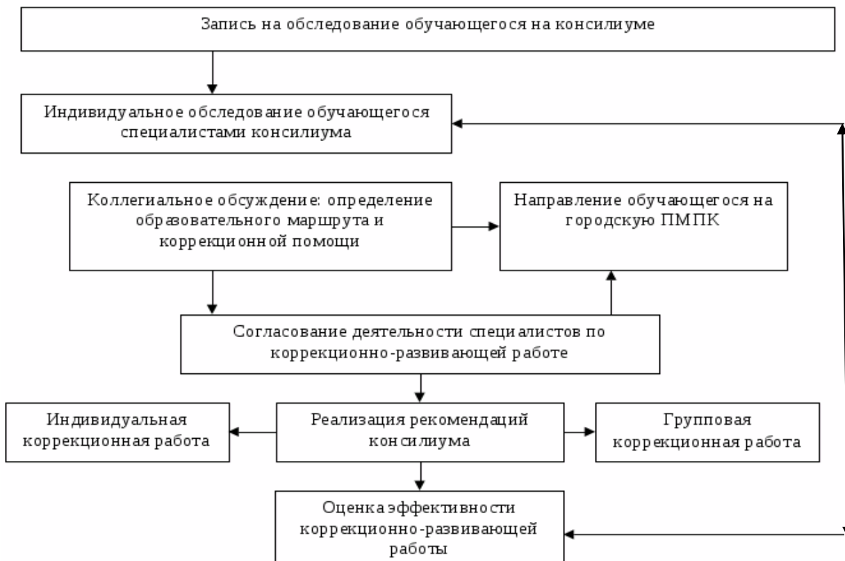
Схема работы ППК МБДОУ д/с № 8 «Огонёк»